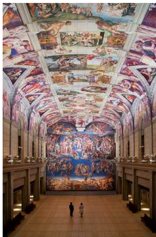
環境展示：「システーナ・ホール」