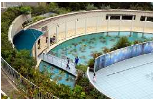
屋外に展示された、モネの「大睡蓮」

ミュージアムショップでは、大塚美術館など、モネや睡蓮で人気が高い美術館のオリジナル睡蓮グッズが登場します！詳しくはホームページをご覧ください。