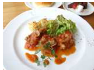
「若鶏の狩人風とタマネギのファルシ」 (1,000円)

【カフェ】モネの大好きなガトーショコラ / モネのフラッペ~緑のハーモニー~ ほか