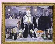
エドゥアール・マネ 「フォーリー=ベルジェールのバー」