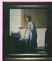
ヤン・フェルメール「真珠の耳飾りの少女(青いターバンの少女)」「手紙を読む女」