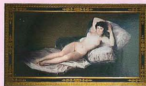
フランシスコ・デ・ゴヤ「裸のマハ」