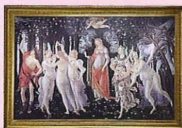
サンドロ・ボッティチェッリ 「春(ラ・プリマヴェーラ)」